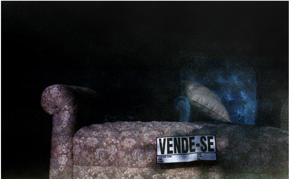
Vivian Castro, Escenas de Cambuci 1 , 2018.