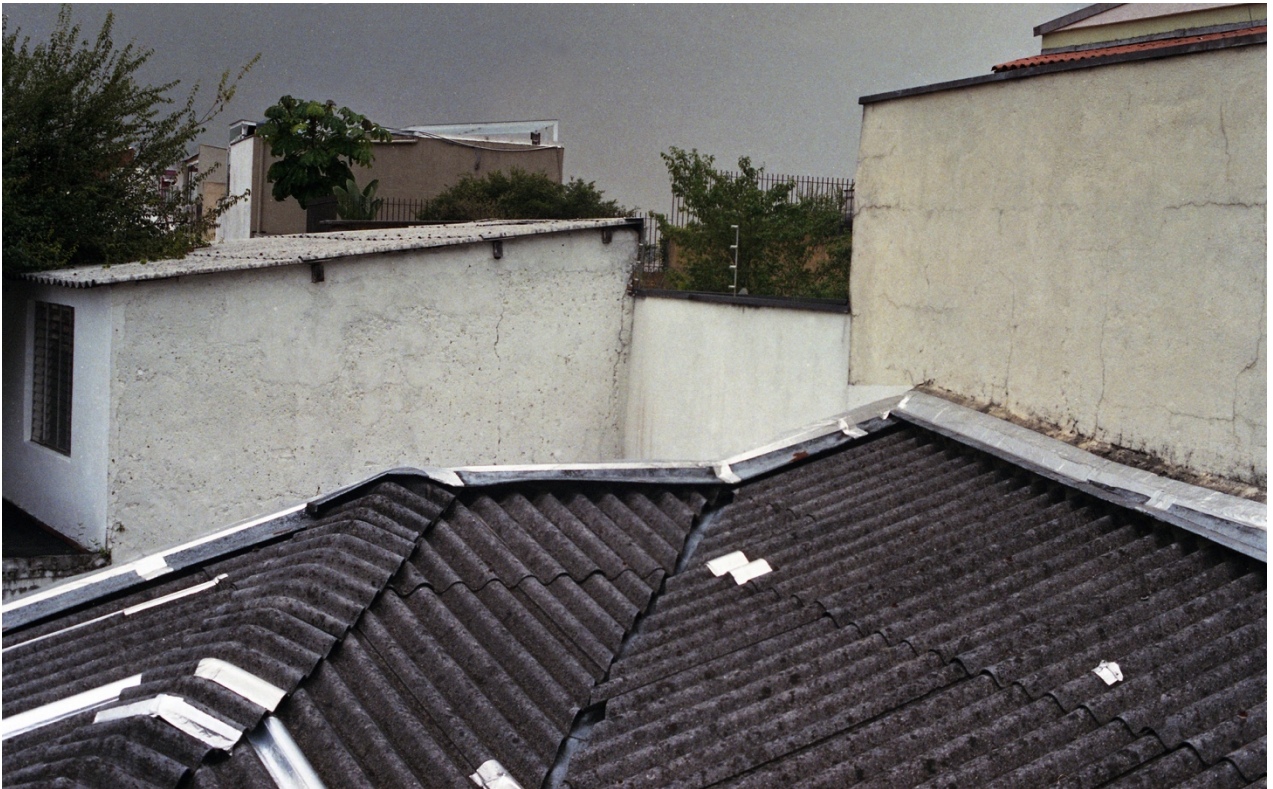
Vivian Castro, Escenas de Cambuci 3 , 2018.