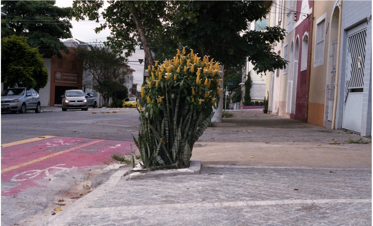
Vivian Castro, Escenas de Cambuci 8 , 2018.