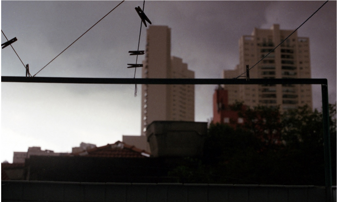
Vivian Castro, Escenas de Cambuci 13 , 2018.