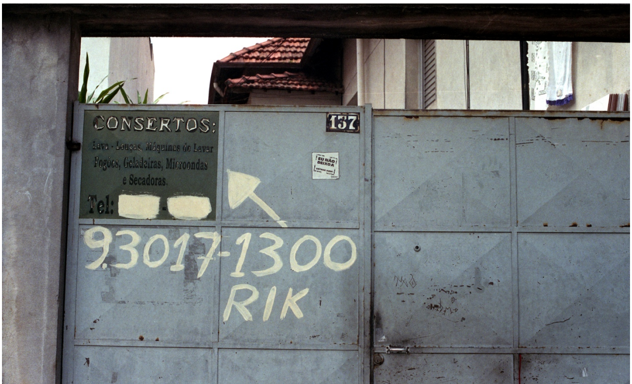
Vivian Castro, Escenas de Cambuci 4 , 2018.