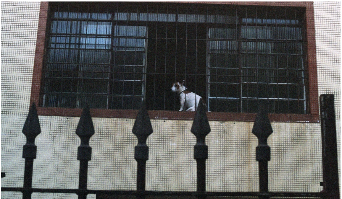
Vivian Castro, Escenas de Cambuci 12 , 2018.