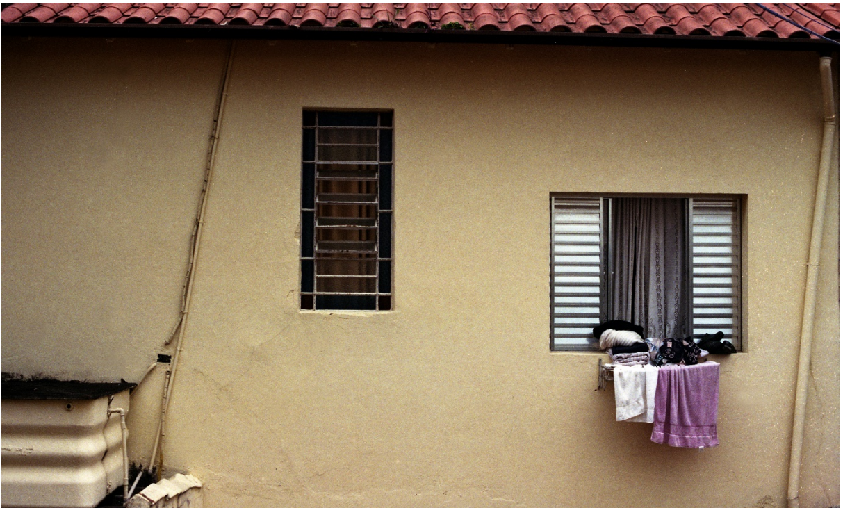
Vivian Castro, Escenas de Cambuci 9 , 2018.