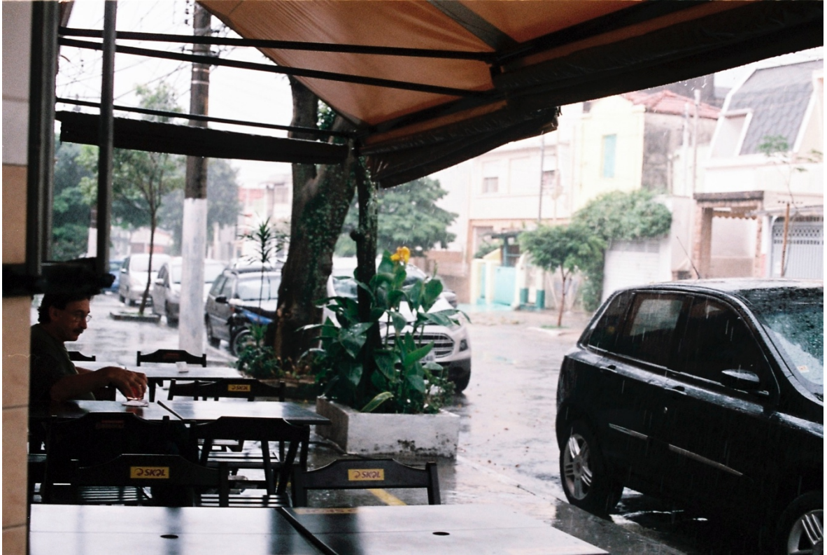
Vivian Castro, Escenas de Cambuci 6 , 2018.