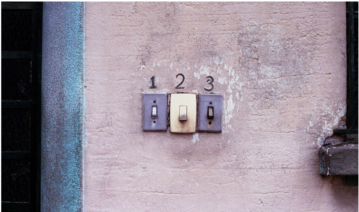
Vivian Castro, Escenas de Cambuci 2 , 2018.