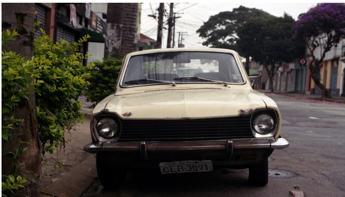
Vivian Castro, Escenas de Cambuci 10 , 2018.

Primero cerro el bar de la esquina, por segunda vez, en menos de tres años. Luego una y otra casa vecina que se vende. Solo en una manzana del barrio, por lo menos unas 10 casas. De pronto, la especulación inmobiliaria llega cerca. Contamos: uno, dos, tres terrenos baldíos a la espera de construcción de edificios. Fantaseamos plazas con juegos para niños. Lo bueno es que, con la crisis, hay un terreno que lleva más de 2 años sin poder conseguir comenzar a construir. Curiosamente se llama “Wonderful - Aclimação”.